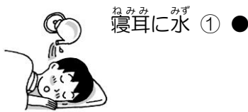
寝耳に水 ① ●

3つのことわざ、それぞれどんな意味でしょうか？ ①～③とア～ウをつなげてみよう！