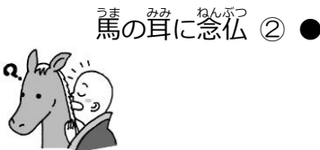
馬の耳に念仏 ② ●

● ア かくしごとは、いつどこで誰が見たり聞いたりしているかわからないということ