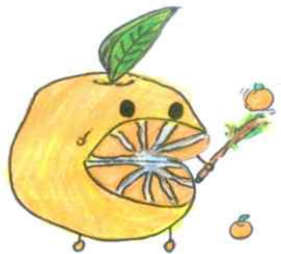
クラスキャラクター「ちびみっかん」